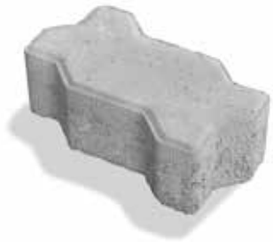
INTERTRAVADO 16 FACES